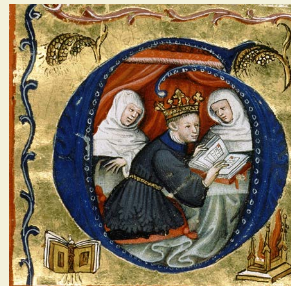
Paris, BNF, Ms. Rothschild, 2529, f. 444v